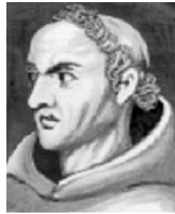
William af Ockam