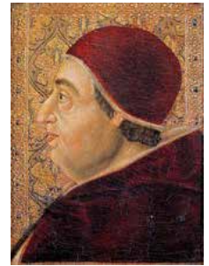
Alexander den 6.