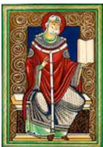
Gregor den første

Pavekirke, Islam, kristenhedens forsvarere: det frankiske og det tysk-romerske kejserdømme.