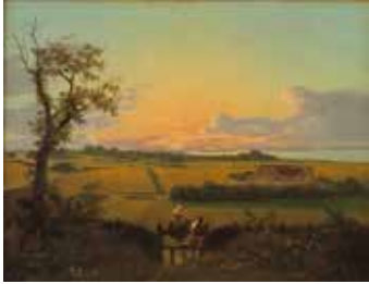
Eckersberg - Fyraften