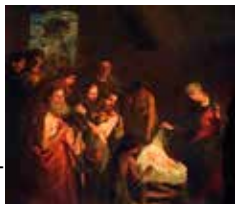
Rembrandt: Hyrdernes tilbedelse

Som tidligere år synger Sydals-koret og kirkens eget ungdomskor og mini-konfirmanderne opfører krybbeopil i kirken.