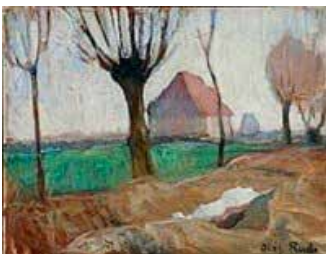
Oluf Rude - landskab