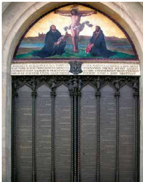
Slotskirken i Wittenberg, hvor de 95 teser er indgraveret i bronze

For at markere at det var den 31. oktober 1517 at Martin Luther opslog sine 95 teser på kirkedøren til Slotskirken i Wittenberg, hvorved reformationen i Nordeuropa tog sin begyndelse, afholder vi reformationsgudstjeneste for Lysabild-Kegnæs Pastorat i Kegnæs Kirke.