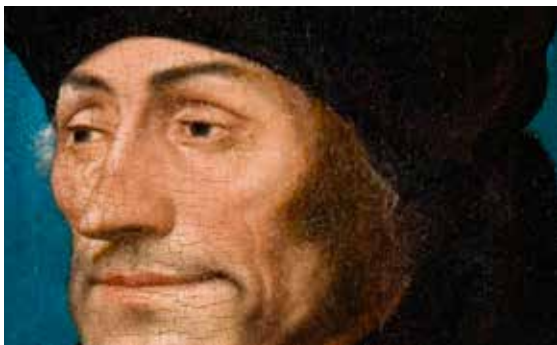
Erasmus af Rotterdam

Den plads tilfaldt Povl Helgesen, der tillige blev bestyrer af det nye kollegium. Povl Helgesen var reformkatolik og på denne tid læste han med begærlighed Luthers skrifter og i kollegiet samlede han om sig en række yngre mænd, der næsten alle senere skulle få en stor betydning for reformationen i Danmark – senere til stor fortrydelse for Povl Helgesen, der hudfletter dem i Skibykrøniken. I hans kollegium havde de lært en kritisk indstilling til den danske katolicisme og kirkelige ledelse, men han havde ikke forestillet sig at de ville gå skridtet videre og blive lutherske prædikanter. I Skibykrøniken får de læst og påskrevet: de er kætterske, frække, snu, forbryderiske, fordrukne, løgnagtige, liderlige og skamløse. Povl Helgesens store forbillede var bibelhumanisten Erasmus af Rotterdam og han oversatte og bearbejdede flere af hans skrifter.